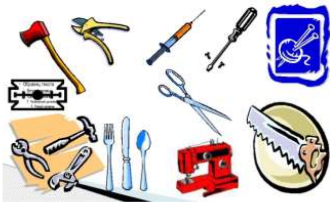
Колющие и режущие предметы

• Еще один источник опасности — разнообразные острые, режущие, колющие предметы — иглы, ножницы, ножи, вилки. Если их использовать по назначению, то они не причиняют вреда. Поэтому важно, чтобы такие предметы лежали на своих местах и использовались по своему прямому назначению.